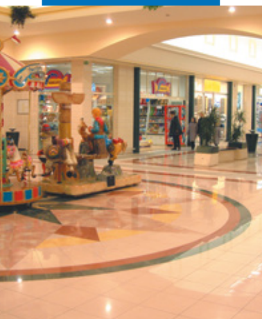
Esempio di posa di grès porcellanato - Centro Commerciale Zanchetta - Treviso

Le referenze relative a questo prodotto sono disponibili su richiesta e sul sito www.mapei.it e www.mapei.com