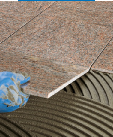
Posa di marmo prelevigato a pavimento

Nel caso di applicazione di lastre fonoassorbenti o isolanti, applicare Keraflex a cazzuola o a spatola a punti.