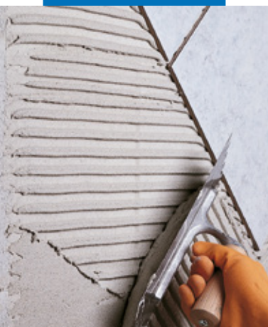
Posa di monocottura su parete in blocchi di cemento cellulare espanso