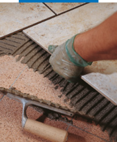
Sovrapposizione di un rivestimento in monocottura su marmette esistenti